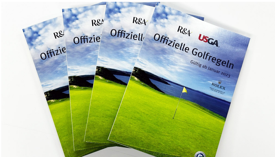
Neue Golfregeln 2023

Zum 1. Januar 2023 werden im üblichen Turnus von vier Jahren die Golfregeln überarbeitet und neu herausgegeben. Hier finden Sie die wichtigsten Änderungen im Überblick.